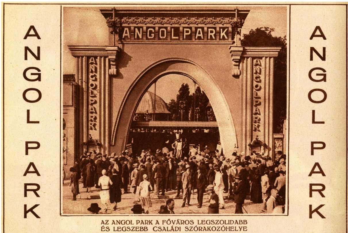
Angolpark art deco stílusú főbejárata