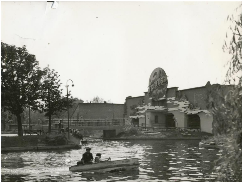
A leégett robogó épülete

1977-ben, a valaha volt legsikeresebb évben több mint 2,8 millió látogatója volt a Parknak, akik fejenként átlagosan 20 forintot költöttek. A sikerek mellett érzékeny veszteségek is érték a Vidám Parkot: a próbaüzem alatt leégett a Robogó épülete, egy piromániás fiatalember felgyújtotta az Elvarázsolt Kastélyt, és halálos baleset történt a Ciklonon.