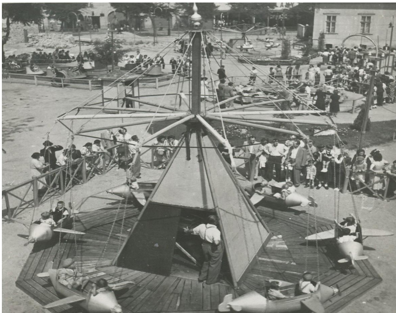
A Kis Vidámpark

A Vidám Park első nagy rendezésére 1952-ben került sor. Akkor készült el az ikonikus főbejárati kapu, a szecessziós körhinta mögötti, eredetileg a tulajdonos birtokában volt kis lakóháza bábszínház költözött, a Robogó körüli területen pedig egy tavat alakítottak ki, ahol motorcsónakázni lehetett. Az Állatkerti körút mentén lebontották a Royal Vio mozi épületét, ennek helyére került a Kis Vidámpark. Itt főleg a Vurstli hajdani kisvállalkozóitól az államosítás során elvett kisebb játékozemek – hajóhinta, csónak, repülő és biciklis körhinta, kisautó – működtek.