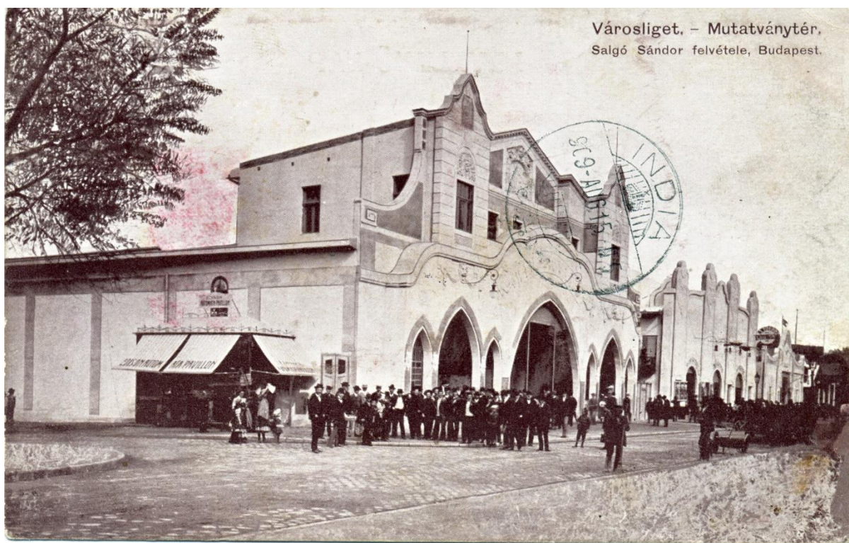
A Barlangvasút épülete 1910 körül

A 19. század első évtizedeiben a pesti vásárokra érkező vándor-mutatványosokat - lövöldéseket, kard-és tűznyelőket, kötéljárókat, képmutogatókat – a város kitiltotta a belső területekről. Ekkor kezdődött megtelepedésük a sokak által látogatott kirándulóhelyen, a Városligetben. Kezdetben a Rondónál, a mai Városligeti fasorral szemközti területen ütötték fel sátraikat, az 1870-es években a Tűzijátéktérre, a Bethesda utcával szemközti telekre költöztek. A mutatványos bódék végleges helyét a főváros 1909-ben az Állatkert területéből kihalászott telekrész és a Hermina út között jelölte ki. Itt rendezkedett be az 1949-ig töretlen népszerűségnek örvendő Vurstli, a kispénzű fővárosiak kedvelt szórakozóhelye.