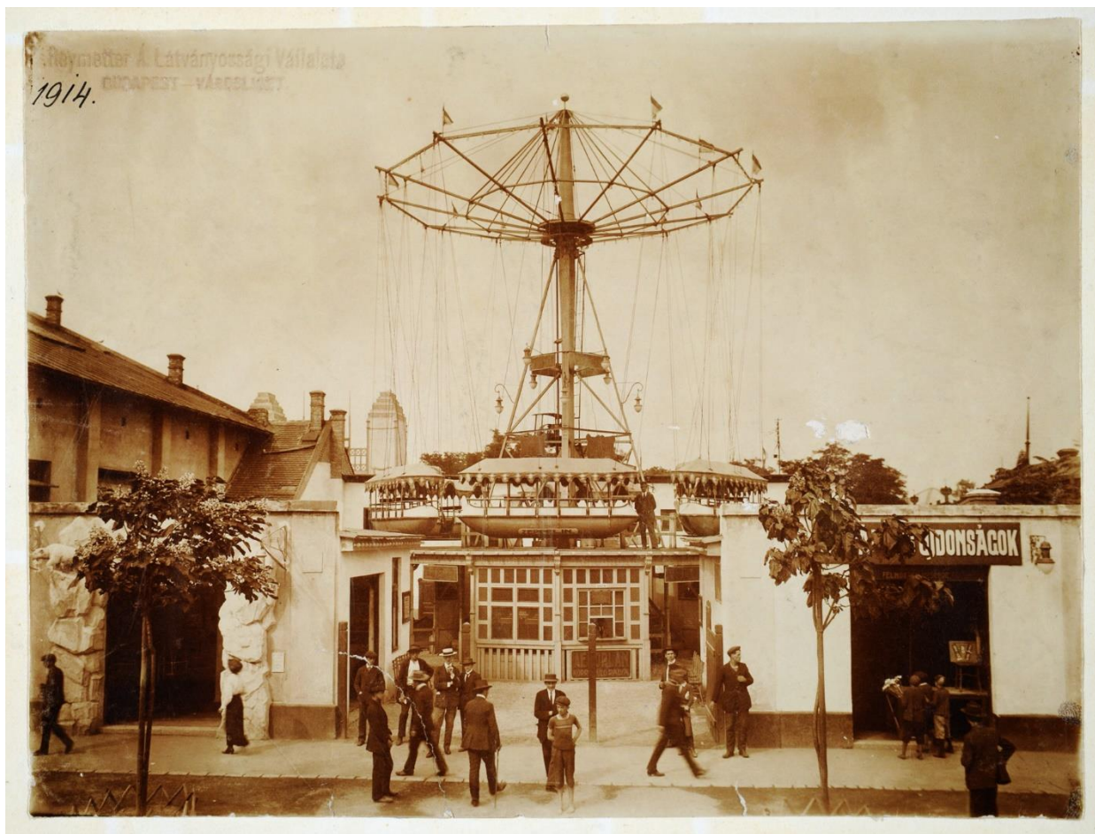
Repülős körhinta, 1914.

Az idők során a Vurstli kínálata sokat változott. A kor követelményeinek és a technikai fejlődésnek megfelelően az 1920-as években megjelent a népszerű villanyautó, a dodgem, az óriáskerék, a Liliputi Színház és a Ródlí nevű hatalmas csúszda.