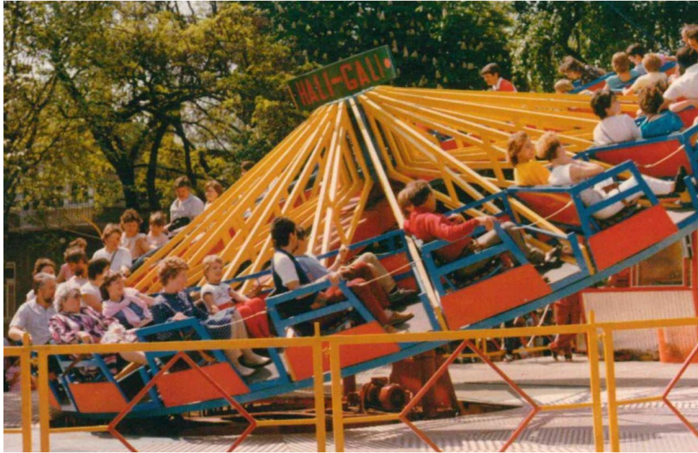
A Hully Gully játék

A gazdasági nehézségek mellett a jó hírnév megőrzéséért is meg kellett küzdenie a Park vezetésének. Az 1980-as évekre állandóvá váltak a razziák, ahol „céltalanul ógyelgő fiatalokra”, iskolából lógó kamaszokra és munkahelyel nem rendelkező „kétes alakokra” vadászott a rendőrség.