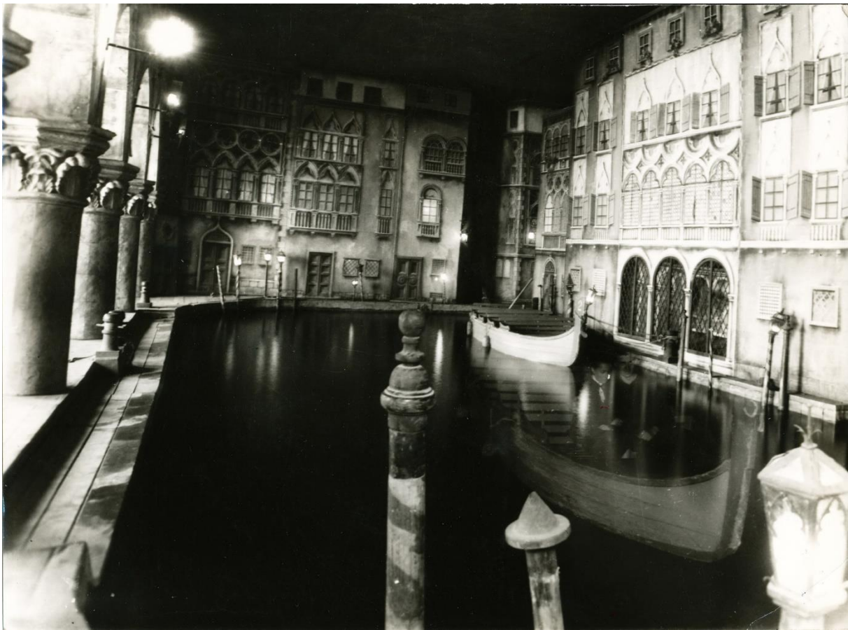
A Velence nevű játék belső tere

A Vidám Park vállalat önállósodása meghozta a remélt pénzügyi sikert az 1970-es évek elején. A gazdálkodás racionálisabb lett, ennek szomorú folyománya volt, hogy a régi, ráfizetéses játéküzemeket elbontották. Így szűnt meg végleg az 1942 óta üzemelő látványos, de a kor emberének már kicsit unalmas Velence, a kedvelt, de korszerűtlen Sikló, a Ródlí, és az Angol Parktól örökölt Kisvasút. 1975-ben a karbantartása miatt rendkívül drágán üzemelő Hullámvasút lebontása is szóba került. Erre végül nem került sor, de a Vidám Park Olaszországból beszerezte a konkurenciának szánt fémvázás pályájú, automatizált magasvasutat, a Ciklont. 1975-ben ez volt a Park szenzációja. Ezekben az években egymást érték a nagyszabású fejlesztések, és a nagy játékgépek beszerzése. 1971-re készült el az új vasbeton héjas dodgem-épület. 1975-ben érkezett a szovjet gyártmányú 31 méter magas, új óriáskerék és a Hurrikán nevű játék. A Planetárium megszűnt, épületébe költöztették a 144 darab új beszerzésű nyerőgépet. Bevezették az egész évi nyitva tartást, igaz télen csak a fűthető épületek üzemeltek. A belépődíj ekkoriban 2 forint volt, de az egyes játéküzemeknél külön is fizetni kellett.