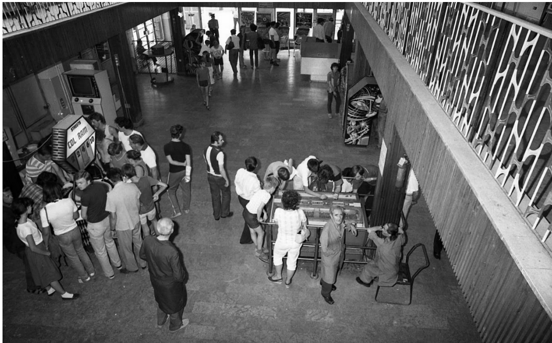
A Planetárium helyén berendezett Játékterem

1977-ben, a valaha volt legsikeresebb évben több mint 2,8 millió látogatója volt a Parknak, akik fejenként átlagosan 20 forintot költöttek. A sikerek mellett érzékeny veszteségek is érték a Vidám Parkot: a próbaüzem alatt leégett a Robogó épülete, egy piromániás fiatalember felgyújtotta az Elvarázsolt Kastélyt, és halálos baleset történt a Ciklonon.