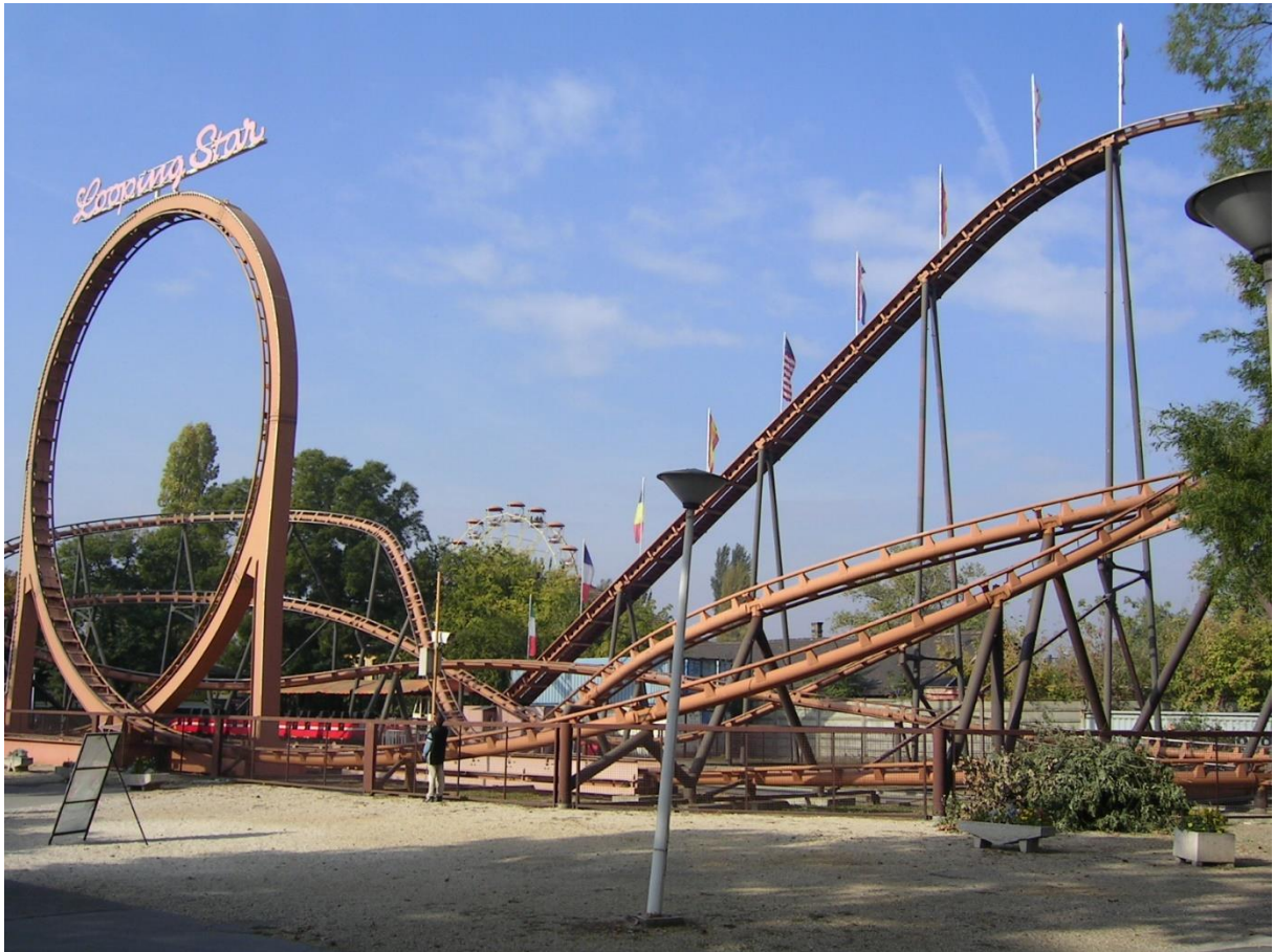
A Looping Star nevű hullámvasút

A Vidám Park jogutód nélküli megszüntetésére végül 2013. szeptember 30-án került sor. Az elbontott játékok az eredeti hirdetési ár harmadáért, mindössze 75 millió forintért keltek el. A terület az Állatkert tulajdonába került, ahol 2016-ban megkezdtek a Biodóm nevű fedett trópusi csarnok építését. 2019-ben a munkálatok leálltak, befejezése a mai napig kérdéses. Budapesten azóta sem épült új Vidám Park.