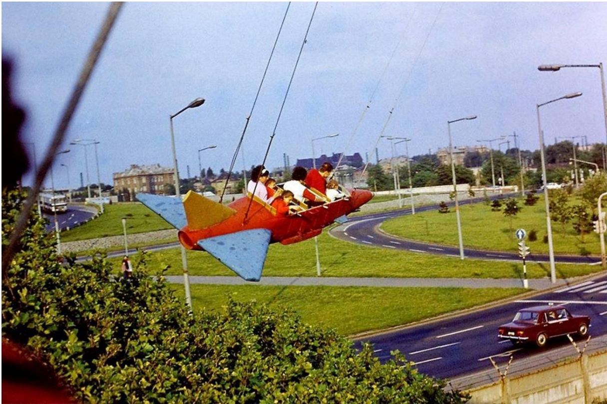
A lebontott Nagy Röpcsi

Bár az 1980-as évek első felében a Vidám Park évi látogatószáma elérte a 3 millió főt, az évtized közepétől a gazdasági recesszió egyre jobban éreztette a hatását. Ráadásul súlyos veszteségeket is el kellett könyvelni a fővárosiak kedvelt szórakozó helyének: a Kacsóh Pongrác úti felüljárórendszer építése miatt el kellett bontani a népszerű Nagy Röpcsi játéküzemet, és a szerkezet károsodása miatt életveszélyessé vált az 1970-es évek szenzációja, a Ciklon. A Robogó körüli tavat évek óta nem tudták feltölteni, a víz elszivárgott, szigetelésre nem volt pénz.