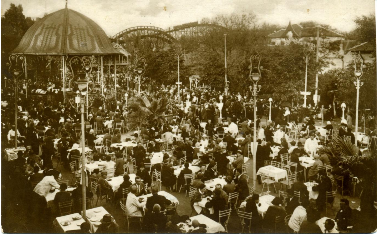
Teltház a Kutassy vendéglő teraszán az 1930-as évek végén

1944 őszén több bombatalálatot is kapott a park, az ostrom alatt a területen komoly harcok dúltak. A háború után az egész komplexum a Szovjet javakat kezelő hivatal irányítása alá került. 1950-ben államosították, és még ugyanebben az évben, a Vurstlival összevonva Vidámparkként éledt újjá a mulató negyed. Sok játéküzem a vidámparki időkben is szolgálta a szórakozni vágyókat. A Kanyargó néven ismert Whip, az Elvarázsolt Kastély, a Vízisikló, a Velence és a ma is álló Hullámvasút mind Meinhardték Angol Parkjának késői túlélői voltak.