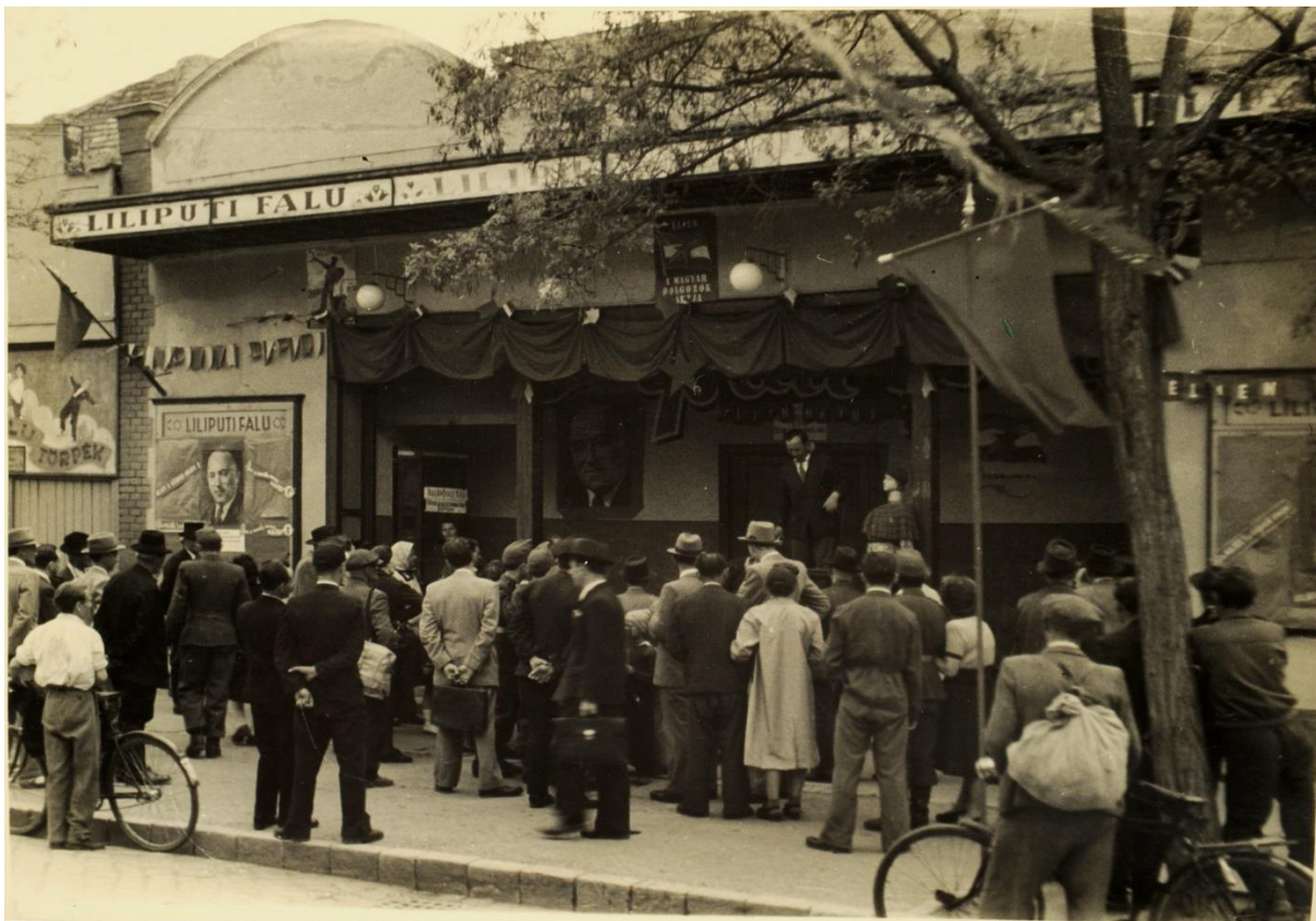
A Liliputi Színház Rákosi Mátyás portréjával

A városligeti mutatványosok életében a döntő fordulatot az 1949-50-es szezon hozta el. A berendezkedő új hatalom a nagyvárosi szórakoztatás korábbi formáit polgári dekadens elhajlásnak minősítette, és a szórakoztatóipart is a kommunista ideológia terjesztésének szolgálatába kívánta állítani. 1948-tól napirenden volt a városligeti szórakozóhelyek megszüntetése, sőt az egész Ligetet moszkvai mintára sport- és kultúrparkká kívánták átalakítani.