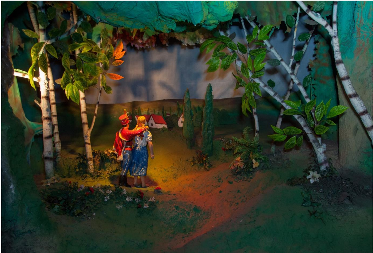
Petőfi Sándor János vitéz című verses meséjének jelenete

A falécekből, gipszből és ralicból készült barlangot védőtetővel fedték le, az erre felhúzott emeleten egy hat szobás lakást alakítottak ki, mely évekig a Meinhardt család otthona volt. Később a Vidám Park munkatársai laktak benne.