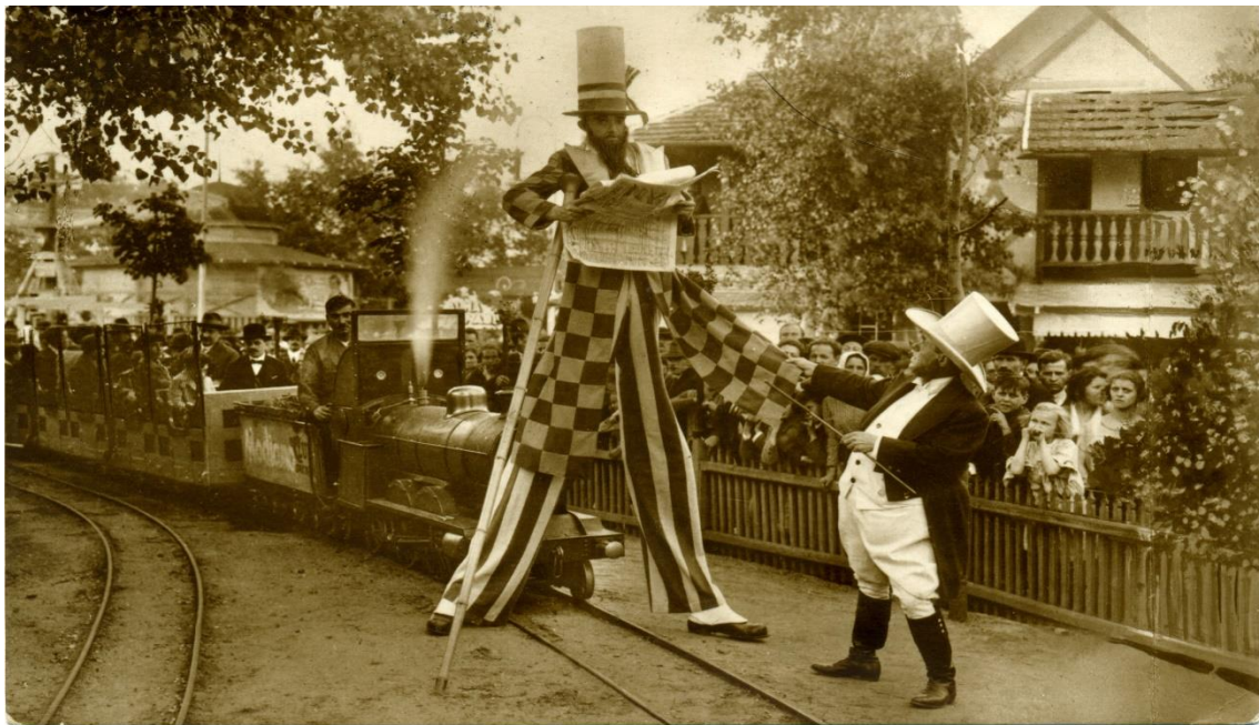
Az Angol Park gólyalábas reklámembere a kisvasúttal

Az 1920-as évek elejétől a környéki telkek megvásárlásával a területet bővítették, és nagyarányú fejlesztéseket hajtottak végre: ekkor készült el a vasúttal határos részen a Ródlí, 1922-ben a favázás Hullámvasút, egy évre rá pedig a Mesecsónak. Szintén ekkortájt nyitott a központi helyen fekvő Terasz étterem és az Alpesi falu vendéglő. A középosztály szórakozási szokásainak változásával az 1930-as évektől egyre több zenés mulatóhelyet, varietészínházat, tánclokált alakítottak ki. Az egyik utolsó fejlesztés volt az 1941-ben megnyílt Velence nevű látványosság, amelyben a Szent Márk teret idéző kulisszák között gondolázhatott a romantikára éhes pesti közönség.