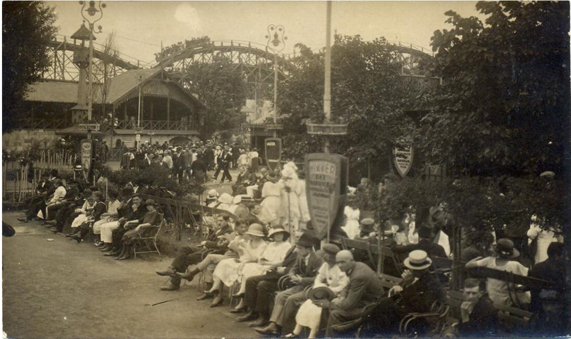
Ételkép az 1920-as évek végén, háttérben a Hullámvasút

Az 1920-as évek elejétől a környéki telkek megvásárlásával a területet bővítették, és nagyarányú fejlesztéseket hajtottak végre: ekkor készült el a vasúttal határos részen a Ródlí, 1922-ben a favázás Hullámvasút, egy évre rá pedig a Mesecsónak. Szintén ekkortájt nyitott a központi helyen fekvő Terasz étterem és az Alpesi falu vendéglő. A középosztály szórakozási szokásainak változásával az 1930-as évektől egyre több zenés mulatóhelyet, varietészínházat, tánclokált alakítottak ki. Az egyik utolsó fejlesztés volt az 1941-ben megnyílt Velence nevű látványosság, amelyben a Szent Márk teret idéző kulisszák között gondolázhatott a romantikára éhes pesti közönség.